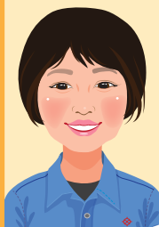
日立笠戸重工業 協業組合 Tさん

悩み苦しむことも多かったですが、多くの技術・知識を取得でき、今の仕事に役立っています。